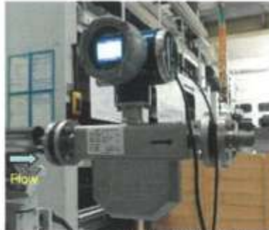
Installation of meter under test (MUT) in calibration line

Note: Meter under Test was provided by the applicant